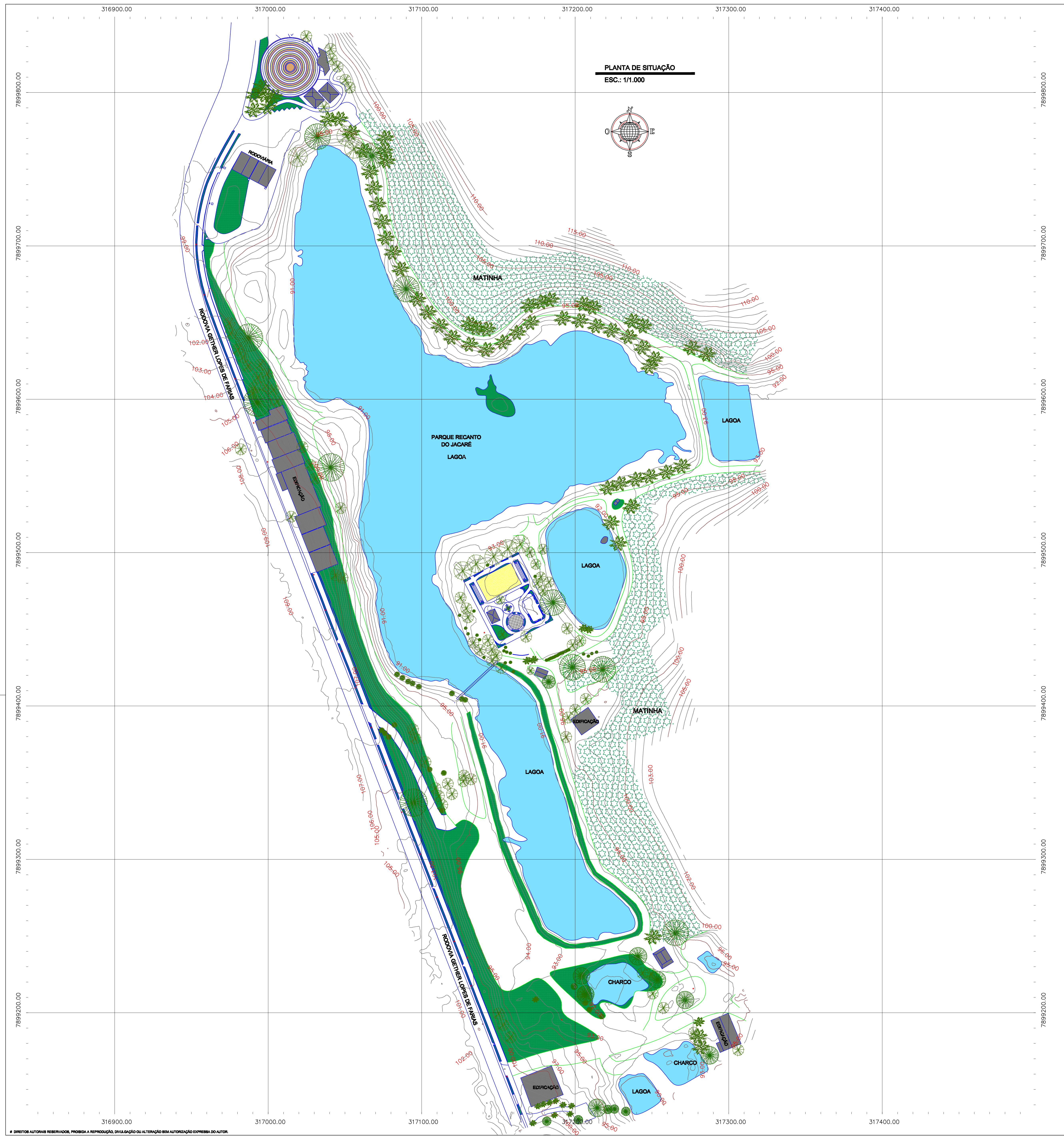
PLANTA DE SITUAÇÃO ESC.: 1/1.000